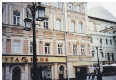
Une réalisation dans le centre de Moscou