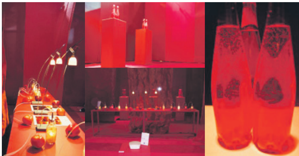
Concepción de un conjunto de luces, materias y colores asociados, sobre el tema «El Color Rojo», realizado por Grupo Idoine.

ad chroma cuenta con el interés activo de